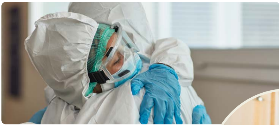
Pandemin visade på bristerna i välfärden. Vänsterpartiet vill bygga samhället starkt igen.

att välfärden ska bli sämre hela tiden, det beror helt på politiska beslut. Vi måste ta tillbaka kontrollen över skola, vård, omsorg och infrastruktur. Det fungerar inte att ge mindre och mindre pengar till verksamheter som dessutom ska ge en allt större andel av de pengarna till privata bolagsvinster. Det har slagit sönder välfärden och skapat otrygghet.