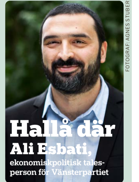
Hallå där Ali Esbati, ekonomiskpolitisk talesperson för Vänsterpartiet