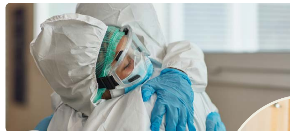
Pandemin visade på bristerna i välfärden. Vänsterpartiet vill bygga samhället starkt igen.

gav är borta. Skolorna drivs för att tjäna pengar istället för att ge utbildning. Vården har man privatiserat, sålt ut och underfinansierat, så att mindre och mindre pengar finns till läkare och undersköterskor. Skulle vi bli sjuka eller arbetslösa kan vi inte vara säkra på att ersättningen går att leva på. Behöver vi en plats på BB kan vi inte vara säkra på att det finns en ledig, behöver vi en ambulans kan vi inte vara säkra på att den kommer i tid. Vi kan inte lita på att skolan har resurser nog att ta hand om våra barn, unga vuxna kan inte flytta hemifrån för att det är sådan bostadsbrist. Det är inte någon naturlag