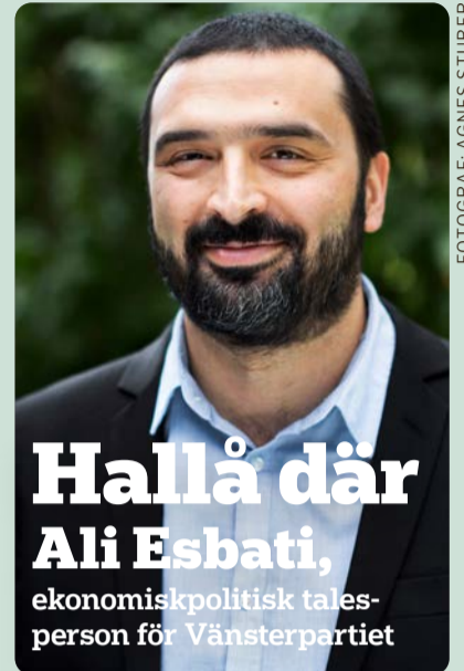
Hallå där Ali Esbati, ekonomiskpolitisk talesperson för Vänsterpartiet