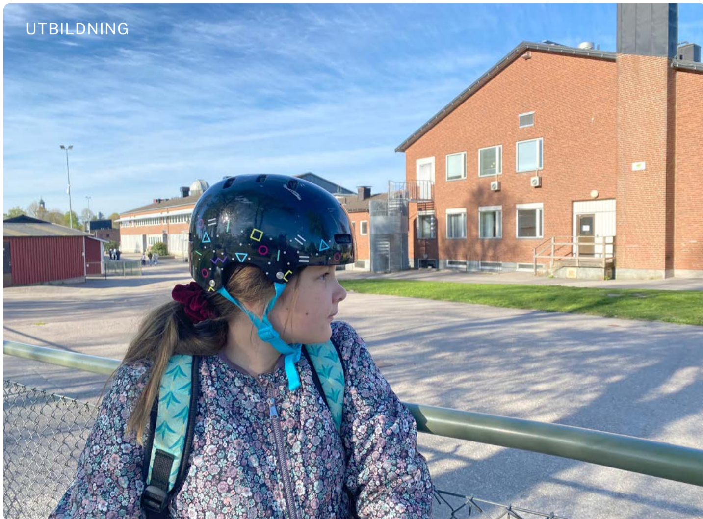
Marknadsskolan. Skolan är till för barnen. Vänsterpartiet vill förbjuda aktiebolag inom skolan - skattepengar ska inte försvinna till privata vinster.