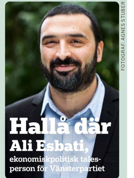
Hallå där Ali Esbati, ekonomiskpolitisk talesperson för Vänsterpartiet