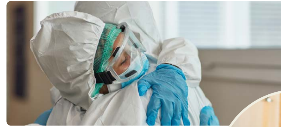
Pandemin visade på brister i välfärden. Vänsterpartiet vill bygga samhället starkt igen.

gav är borta. Skolorna drivs för att tjäna pengar istället för att ge utbildning. Vården har man privatiserat, sålt ut och underfinansierat, så att mindre och mindre pengar finns till läkare och undersköterskor. Skulle vi bli sjuka eller arbetslösa kan vi inte vara säkra på att ersättningen går att leva på. Behöver vi en plats på BB kan vi inte vara säkra på att det finns en ledig, behöver vi en ambulans kan vi inte vara säkra på att den kommer i tid. Vi kan inte lita på att skolan har resurser nog att ta hand om våra barn, unga vuxna kan inte flytta hemifrån för att det är sådan bostadsbrist. Det är inte någon naturlag