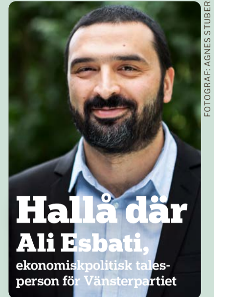
Hallå där Ali Esbati, ekonomiskpolitisk talesperson för Vänsterpartiet